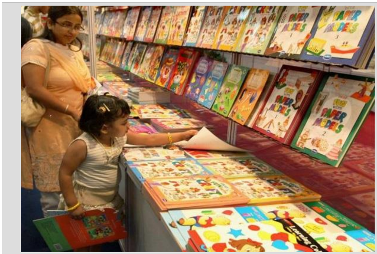
نمایشگاه بین المللی دوسالانه کتاب دهلی