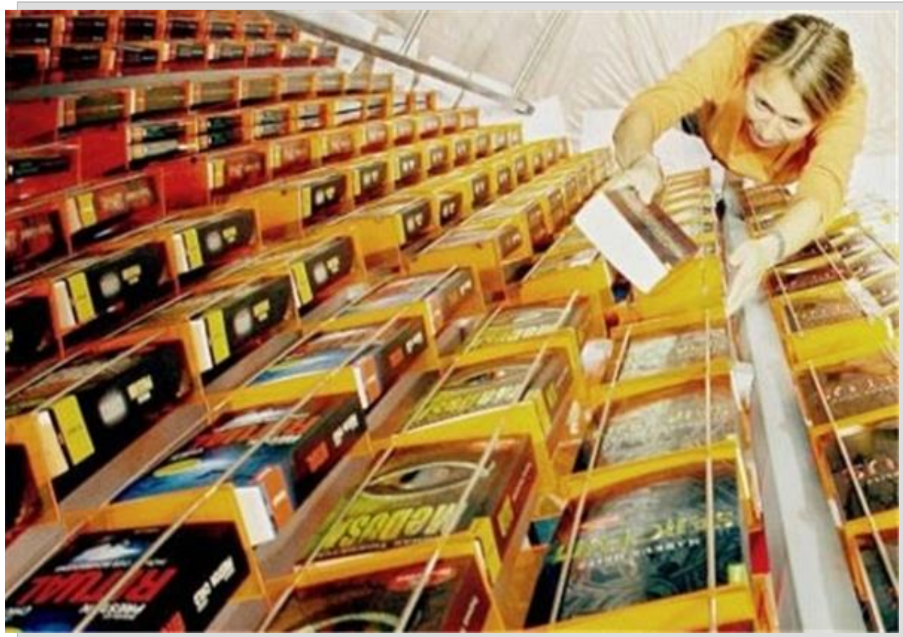
یکی از غرفه‌ها در نمایشگاه کتاب فرانکفورت