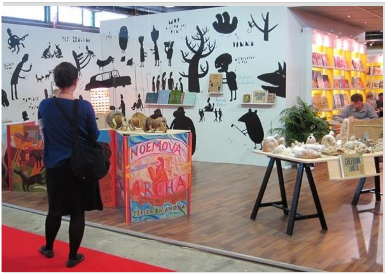
نمایشگاه بین‌المللی کتاب کودک ایتالیا _ بلونیا

شده و به نمایش گذاشته می‌شود. این نمایشگاه موقعیت مناسبی برای ارزیابی آثار منتشر شده در سطح جهانی و بازاریابی وسیع برای ناشران است. زیرا مرکز بیشترین توجه ناشران کتاب کودک از سراسر جهان محسوب می‌شود.