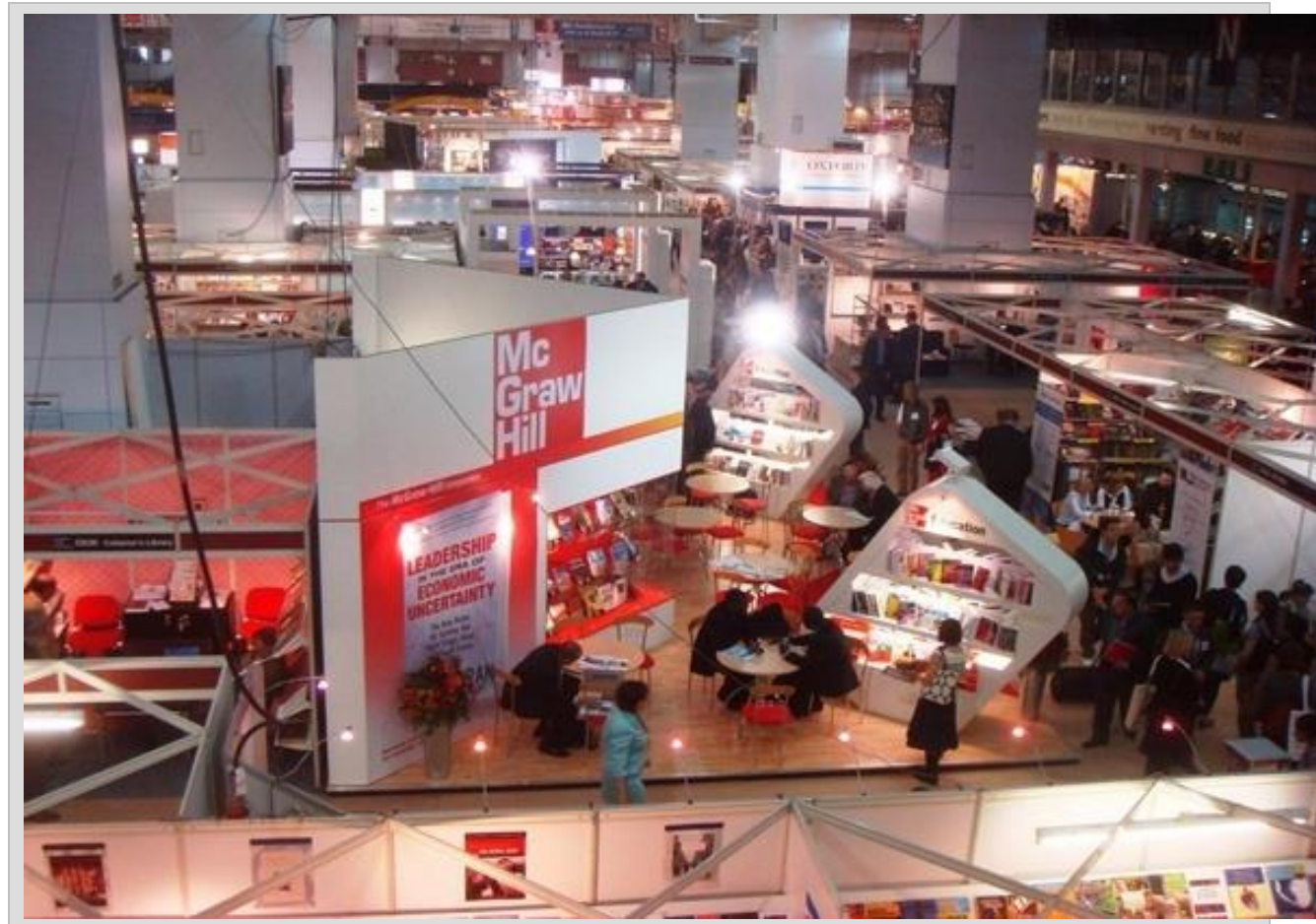
نمایشگاه بین المللی کتاب لندن