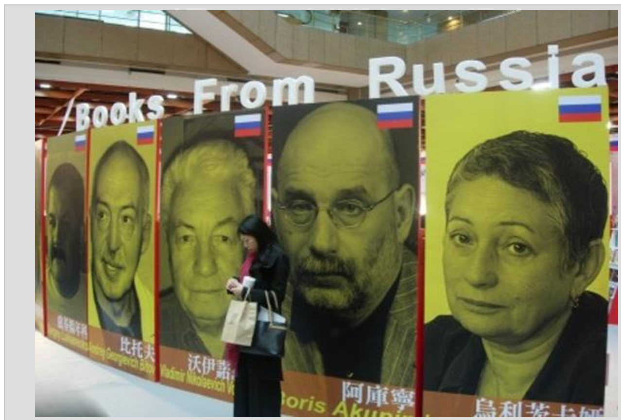
نمایشگاه بین المللی کتاب روسیه