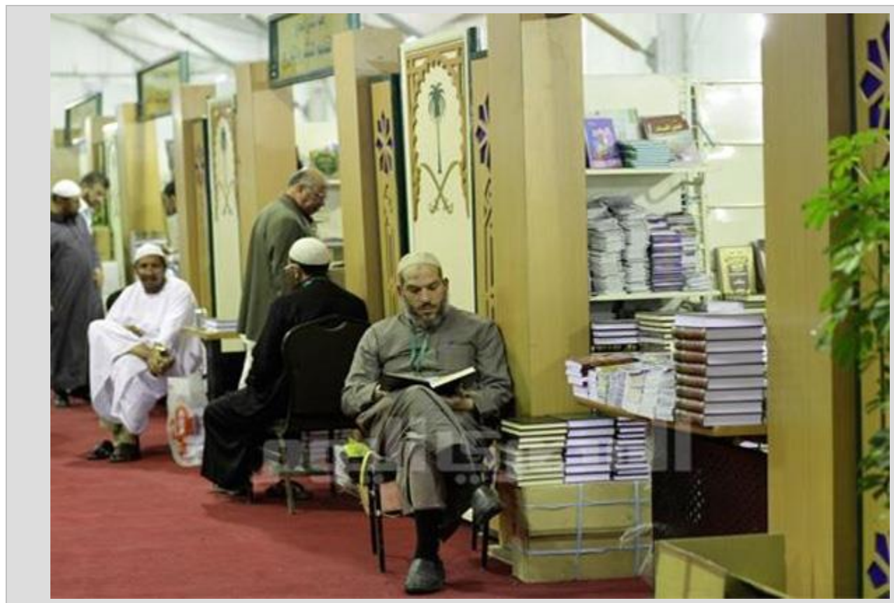
نمایشگاه بین‌المللی کتاب مصر _ قاهره