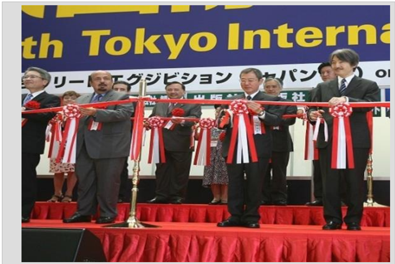
مراسم جالب افتتاحیه نمایشگاه بین المللی کتاب توکیو

3. نمایشگاه بین المللی کتاب توکیو: (نوزدهمین دوره آن از ۵ تا ۸ جولای، 15 تا ۱۸ تیر ۱۳۹۱ در توکیو ژاپن برگزار شد)؛ این نمایشگاه که دومین نمایشگاه بزرگ جهان شناخته می‌شود با تمرکز بر ادبیات داستانی، کتاب‌های تجاری و کتاب‌های الکترونیکی و مانگا (کارتون ژاپنی) برپا می‌شود. در سال 2011 تمرکز این نمایشگاه بر کشور اسپانیا بود و توانست ۸۸ هزار و ۷۶۷ نفر از ۲۳ کشور را به خود جذب کند. نمایشگاه بین المللی کتاب توکیو دومین بازار بزرگ نشر جهان است که هر ساله در ماه جولای برگزار می‌شود. در واقع این نمایشگاه به عنوان شاخص‌ترین رویداد نشر آسیا محل اصلی تجارت نشر برای وارد کنندگان و کتاب‌فروشان و فرصت خوبی برای حرفه‌ای‌های صنعت نشر است تا تجارت خود را در آسیا گسترش دهند.