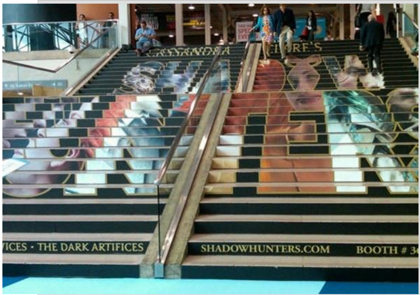
ورودی نمایشگاه کتاب آمریکا که تصویر روی جلد یک کتاب است