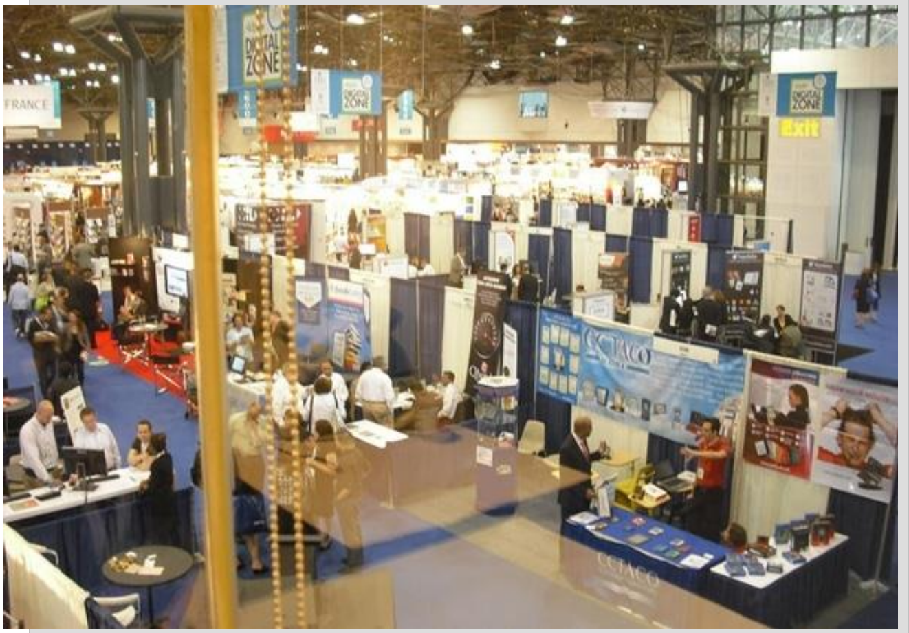
نمایشگاه کتاب آمریکا (بوک اکسپو)