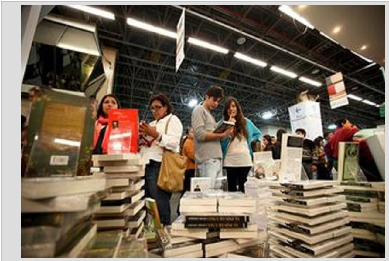
نمایشگاه بین المللی کتاب گوادالاخارا _ مکزیک

*نمایشگاه قاهره و تاثیرپذیری از بیداری اسلامی