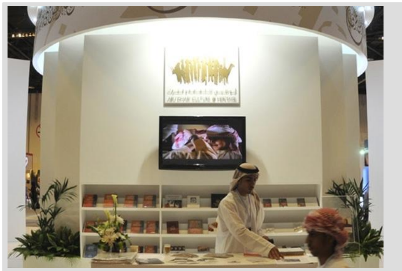
نمایشگاه بین المللی کتاب ابوظبی

این نمایشگاه در سال ۲۰۱۲ با تمرکز بر ناشران بریتانیایی برگزار شد. لازم به ذکر است که نمایشگاه کتاب ابوظبی که تخصصی‌ترین نمایشگاه کتاب در دنیای عرب است، در چهار سال گذشته، نگاه ویژه‌ای به نشر کتاب کودک داشته است. هدف این بخش، تشویق کودکان به کتاب‌خوانی به عنوان فعالیتی برای لذت، کشف و یادگیری است.