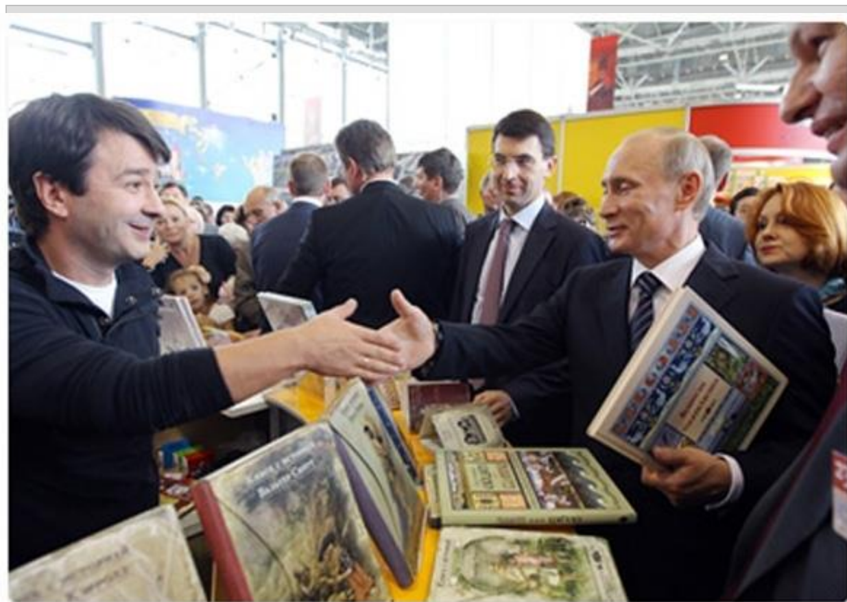
پوتین در نمایشگاه کتاب روسیه