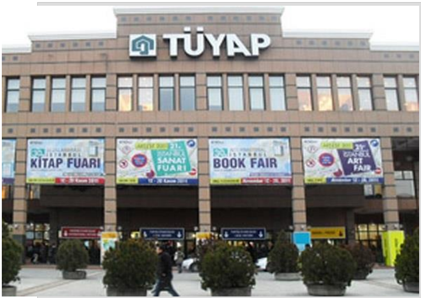
نمایشگاه بین المللی کتاب ترکیه در استانبول

*بزرگترین رویداد برای کتاب‌های اسپانیایی زبان