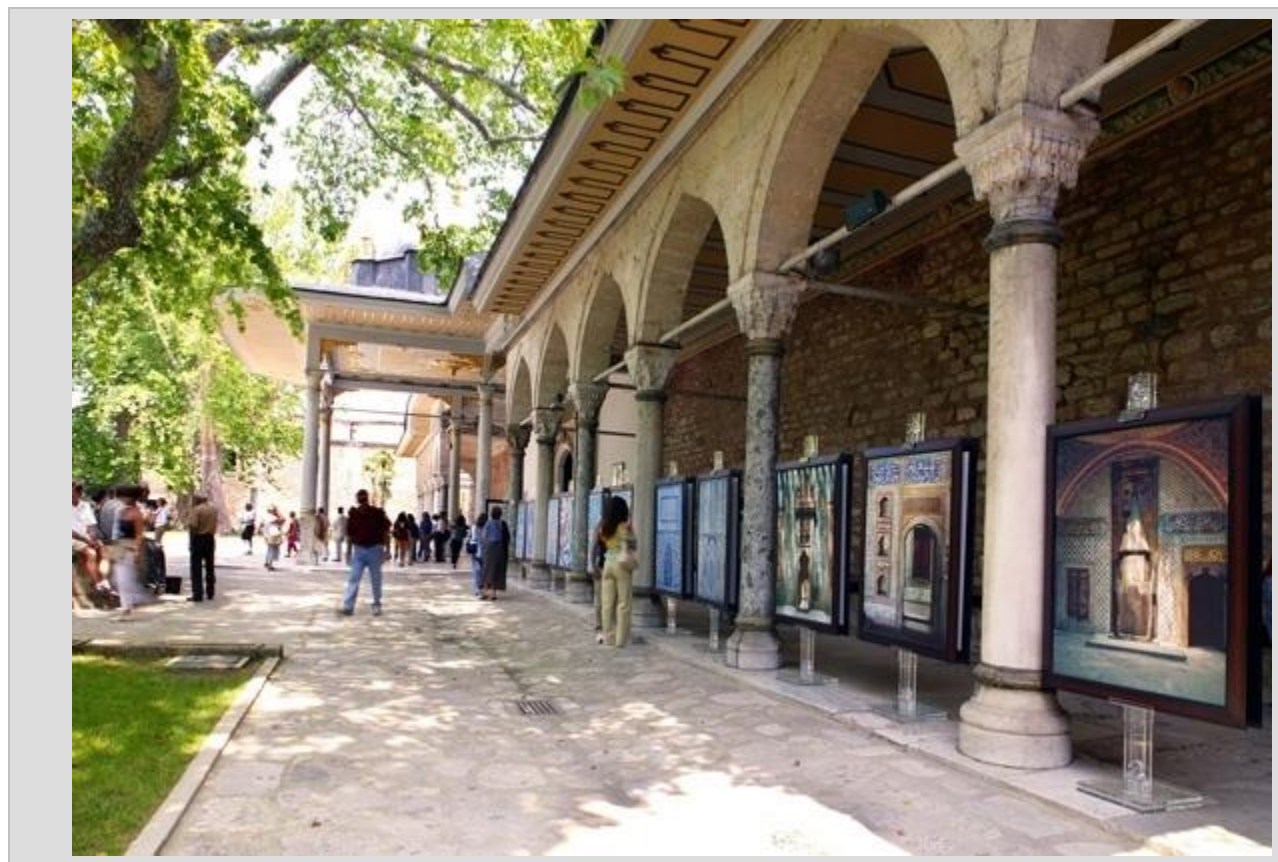
بخش جنبی نمایشگاه کتاب فرانکفورت در معرفی فرهنگ دیگر کشورها