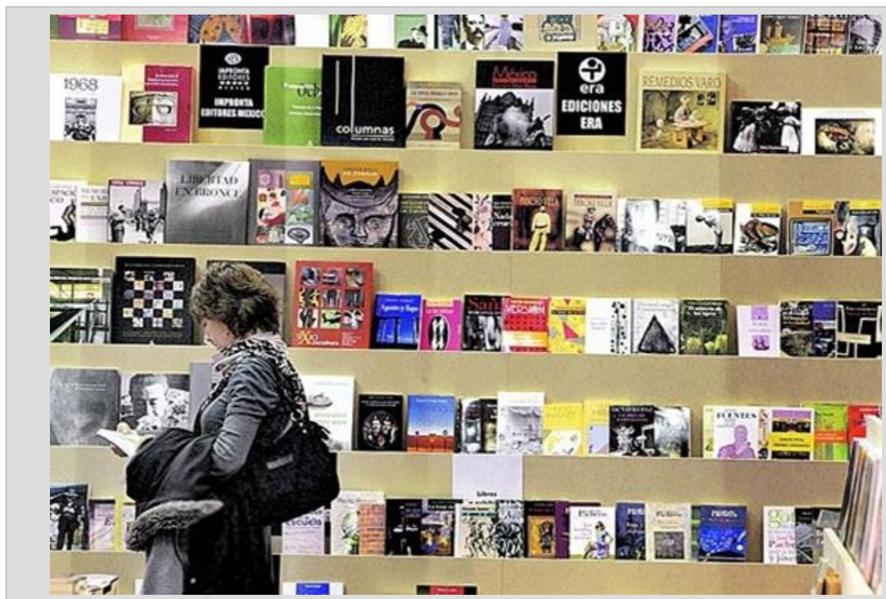
نمایشگاه بین المللی کتاب فرانسه _ پاریس (Salon du Livre)

*نمایشگاهی تخصصی برای کودکان با فرصت‌های بی‌شمار برای هر بازدید کننده