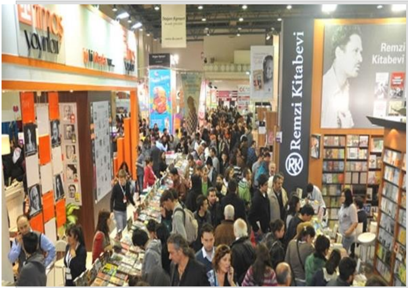
فضای داخلی نمایشگاه کتاب ترکیه