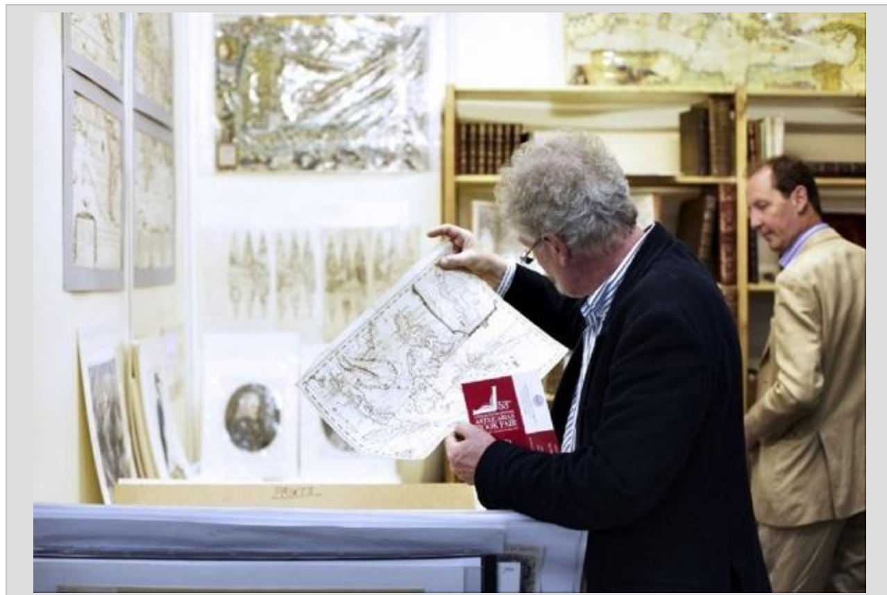
یکی از بازدید کنندگان نمایشگاه کتاب لندن در حال مشاهده نسخه‌های خطی و نایاب

۲. نمایشگاه کتاب لندن (چهل و یکمین دوره آن از ۱۶ تا ۱۸ آوریل، ۲۸ نت ۳۰ فروردین ۹۱ و در سال ۲۰۱۲ برگزار شد.) این نمایشگاه به عنوان مهمترین نمایشگاه کتاب بهاره اروپا و بزرگترین رویداد صنعت نشر بریتانیا امسال میزبان بیش از ۲۳ هزار شخصیت حرفه‌ای در عرصه نشر بود که بیش از ۱۰۰ کشور جهان راهی این نمایشگاه شدند. امسال در این نمایشگاه، بازار کتاب کشور چین مرکز توجه قرار داشت.