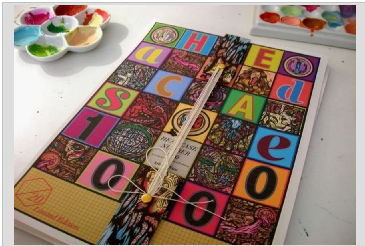
بخش هنر تزئین کتاب در نمایشگاه کتاب توکیو

برای مثال، نمایشگاه ۲۰۰۸ کتاب توکیو میزبان ۷۶۳ غرفه نمایشگاهی از ۳۱ کشور بود که ۶۱ هزار و ۳۸۴ بازدیدکننده داشت. نمایشگاه ۲۰۰۹ کتاب توکیو نیز با جذب ۱۷ هزار و ۴۹۵ ناشر و نماینده ادبی از ۹ تا ۱۲ جولای برگزار شد. همچنین نمایشگاه جهانی نشر دیجیتال ۲۰۰۹ همزمان با نمایشگاه ۲۰۰۹ کتاب توکیو در مرکز ابداعات و فناوری های نوین در توکیو برگزار شد.